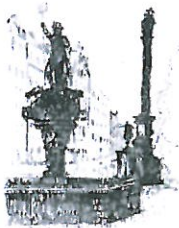
Rynek Fontanna z Neptunem